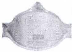
ILUSTRACIÓN: MEDIDAS DE BIOSEGURIDAD Y CONTROL DE INGRESO A RECINTOS PARA DESARROLLO DE PRUEBA ESCRITA

Estado Plurinacional de Bolivia Ministerio de Educación Moromboaguasu Jeroata Yachay Kamachina Yaticha Kamana