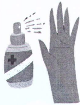
IMPLEMENTOS DE BIOSEGURIDAD